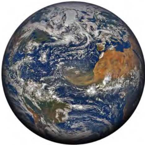
Image satellite de la NASA (18 juin 2020) au dessus de l'Océan Atlantique montrant le flux de transport de poussière désertique du nord de l'Afrique vers l'Amérique Centrale