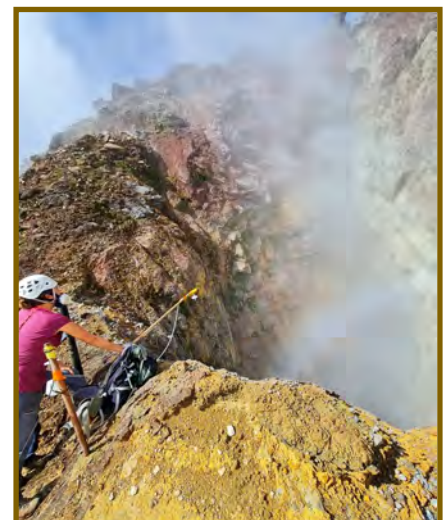
Mesure de la composition chimique du panache volcanique de la Soufrière, au niveau du Gouffre 1956. Mesure effectuée par MultiGAS par l'équipe de l'OVSG (gaz étudiés : H 2 O, CO 2 , SO 2 , H 2 S et H 2 ).

Ce manque de connaissance est un verrou critique qu'il faut lever afin de sensibiliser les collectivités, les institutions, les agences et les citoyens à cette problématique des « aérosols naturels » et d'apporter de nouveaux outils de connaissance qui permettront de mieux prendre en considération ces enjeux.