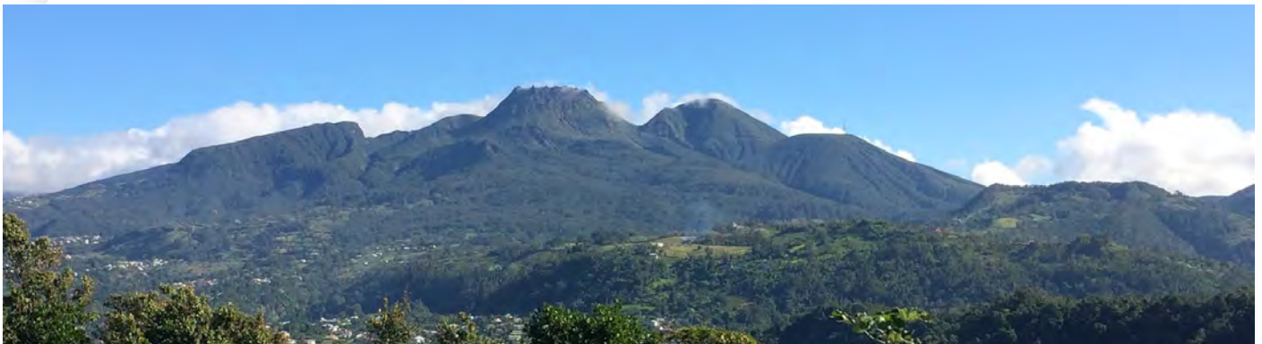
Le massif de La Soufrière et les communes de Saint-Claude et Gouibeyre en contrebas.