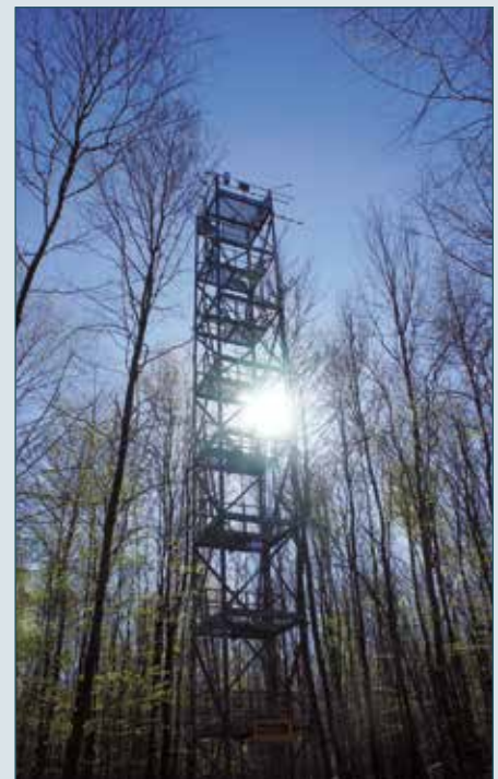
Sur le site ICOS de Hesse, cette tour à flux de 35 mètres mesure en continu les échanges gazeux (CO 2 , gaz à effet de serre...) entre la forêt et l'atmosphère.